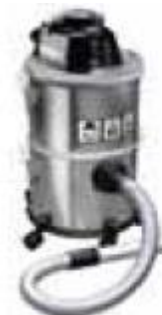
WERSJA DO KOMINKÓW