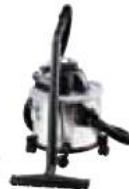
WERSJA NA SUCHO